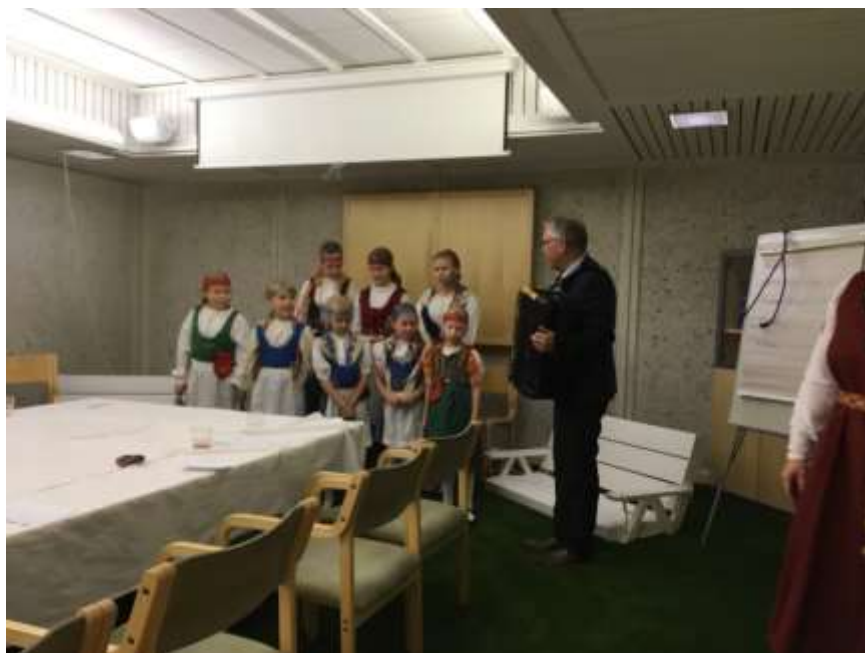
Perinneporina 1/2020 ● 7