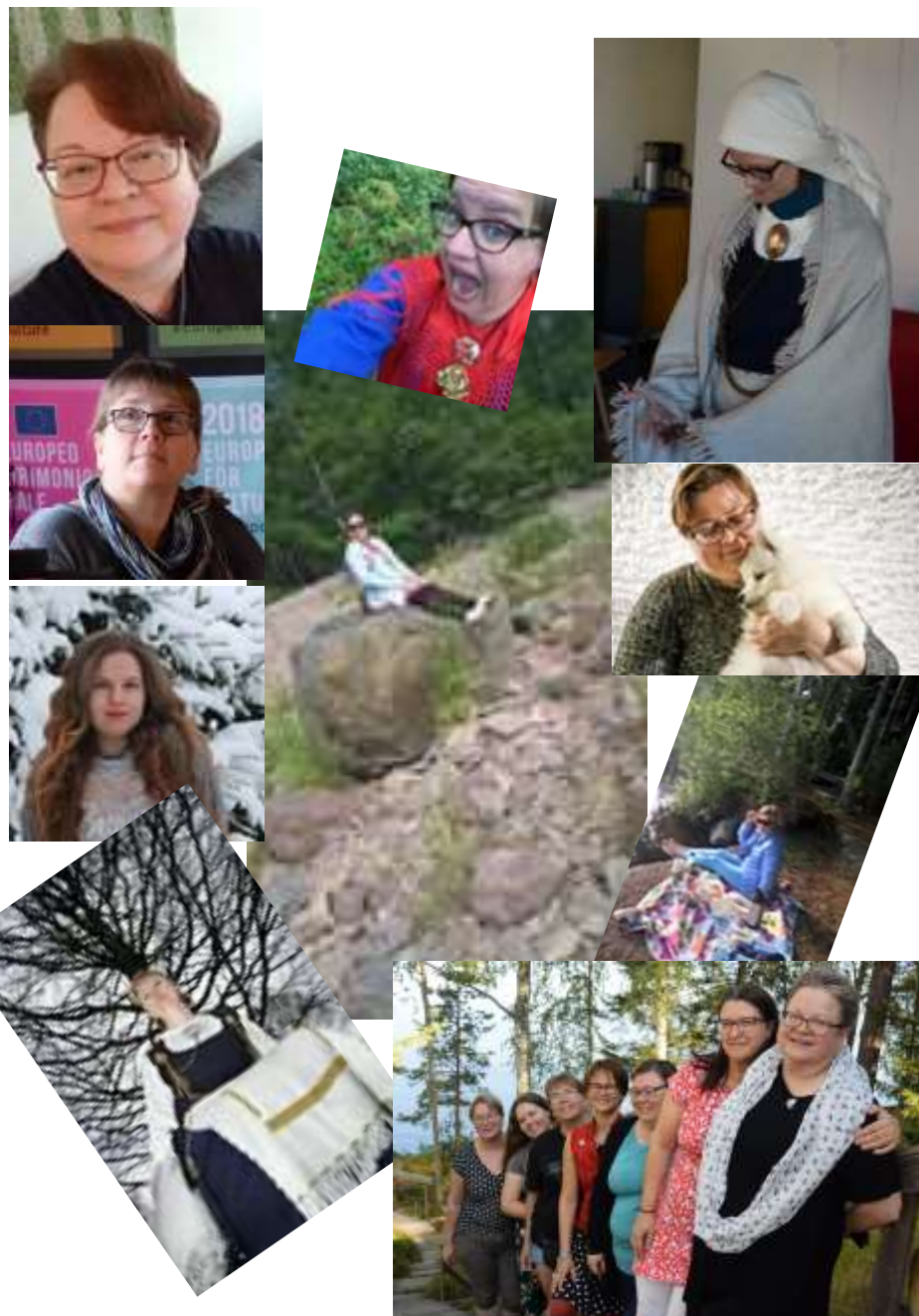
Perinneporina 1/2020 ● 8