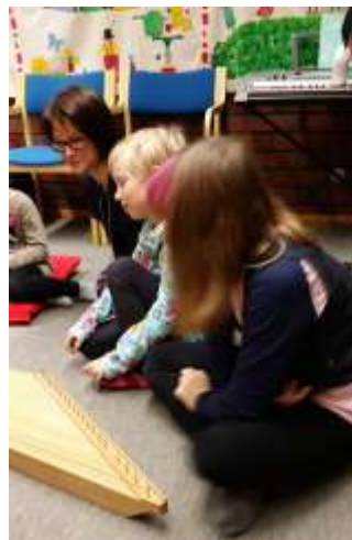
Perinneporina 1/2016 • 5